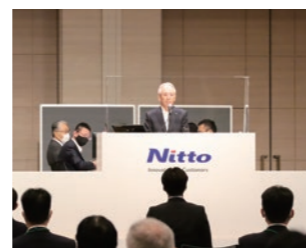
第157回定時株主総会の様子

※ 第157回定時株主総会はCOVID-19の感染拡大防止策を講じたうえで開催しました。