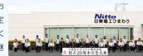
創立記念式典の様子

障がい者の1年後の定着率は一般的に約60%と言われますが、ひまわりグループでは90%以上です。現在は国内に6拠点を構え、2021年2月末時点で290名を超える従業員が働いており、国内でのNitroグループ障がい者雇用率は、2021年3月時点の法定雇用率2.3%を上回る3.5%に達しています。同社設立時の想い「ものづくりを通して達成感を味わい、働くことの喜びを感じて欲しい」を今後も引継ぎ、自立を目指す障がい者を支援していきます。