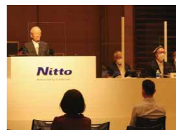
第156回定時株主総会の様子

※ 第156回定時株主総会はCOVID-19の感染拡大防止策を講じたうえで開催しました。