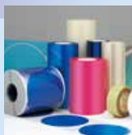
半導体ウエハ保護・固定用テープ エレップホルダー®