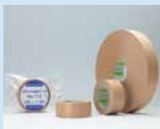
クラフト粘着テープ