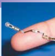
精密回路付き薄膜金属基板 CISFLEX®