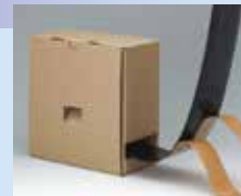
防水気密テープ ハイパーフラッシュ®