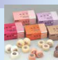
医療衛生材料 優肌絆®