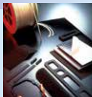
発泡シール材 エプトシーラー®