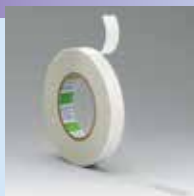
ゴム系両面テープ