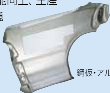
鋼板・アルミ板補強材 ニトハード®

自動車・鉄道車両・航空機などの輸送機の性能向上、生産効率化、環境負荷低減に役立っています。