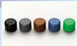
内圧調整材料 テミッシュ®