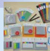
文房具 STÁLOGY® シリーズ