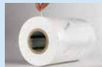
レーザー加工用表面保護材 LASERGUARD®