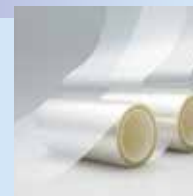
光学用透明粘着シート LUCIACS®