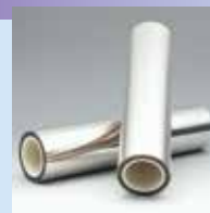
透明導電性フィルム エレクリスタ™