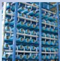
海水淡水化スパイラル型 RO膜