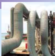
屋外防食テープ ニトハルマック® XGシリーズ