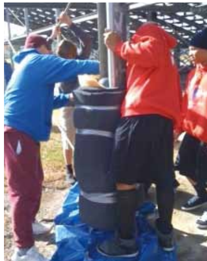
梱包材を巻き付けたゴールポスト