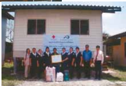
義援金で復旧した図書館と住宅