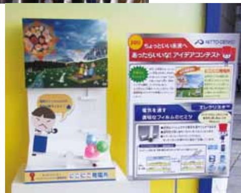
「にここに発電」 デモ機