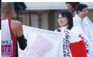
大阪ハーフマラソンの タオルかけボランティア