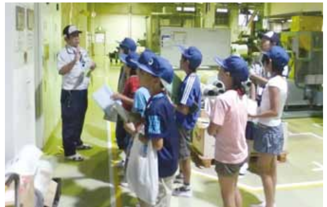
熱心に説明を聞く子どもたち

子供たちは実験やクイズを通して先端科学に触れ、「もっと科学が好きになりました」との感想も聞かれました。