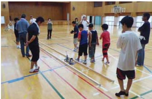
ミニカーを走行させる子供たち

豊橋の地区大会で選抜されたチームは、その後の全国大会で、見事「銀賞」を受賞しました。