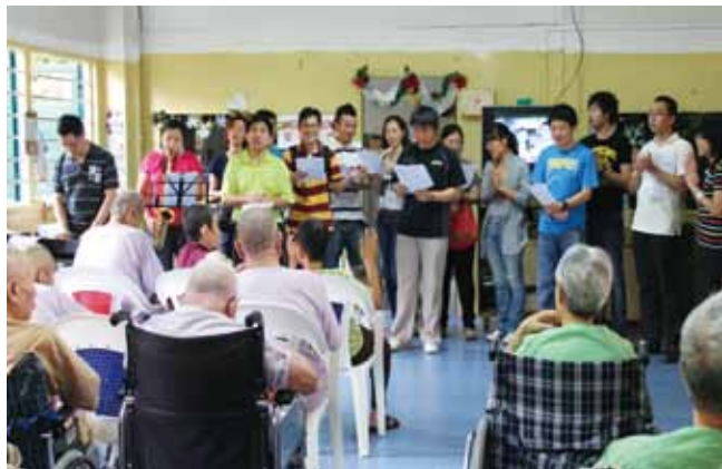
歌と演奏を披露する従業員

訪問が終わると、参加した社員はお互いの訪問の様子を語り合い、この2つの施設のために募金を行いました。