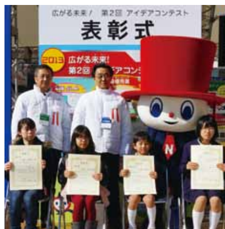
アイデアコンテスト 表彰式

また、昨年のアイデアコンテストで最優秀賞を受賞した「にここに発電所」をイメージしたデモ機を、当社の製品を使って作製し、イベント会場に展示しました。