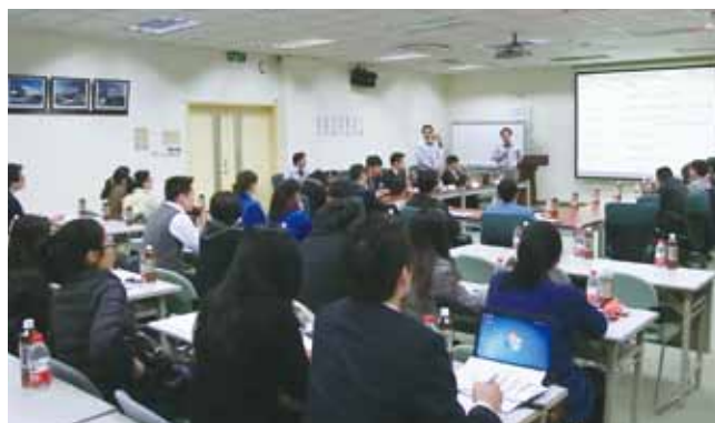
中国の日東電工(上海松江)で開催された説明会

2013年度は引き続きお取引先様の協力のもと、EUでのREACH規制における第9次SVHC物質の調査などを随時実施する予定です。