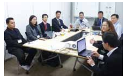
車座ミーティング