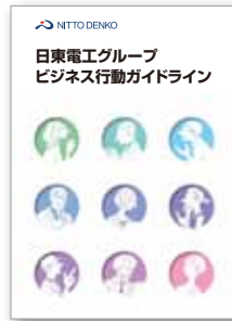
「ビジネス行動ガイドライン」

日東電工グループで働くすべての人に配布され、すべての従業員が読めるように、現在16言語に翻訳されています。