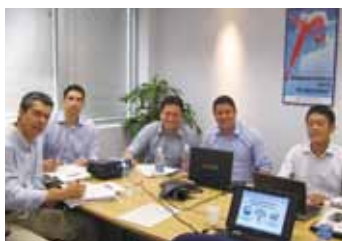
新しい工場建設も進み、活気あるブラジルの日東電工ラテンアメリカでも、今回初めて開催。