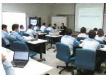
台湾日東光学での開催風景。CSR委員会もあり、積極的な活動が行われている。